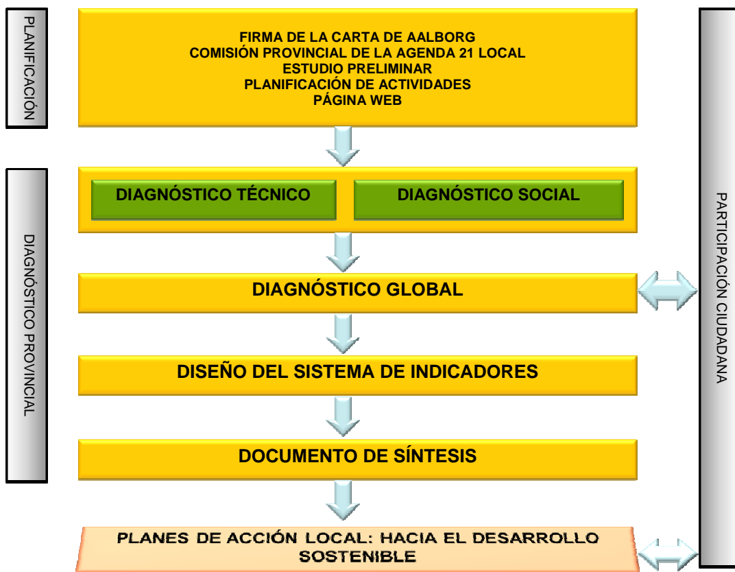
Figura 1. Etapas en la agenda 21 provincial de Almería

El proceso de Agenda 21 comienza con la aprobación y firma en el Pleno del Ayuntamiento de los compromisos expresados en la Carta de las Ciudades Europeas hacia la Sostenibilidad (Carta de Aalborg). Mediante esta firma la administración local asume el desarrollo sostenible y se compromete a implantar estrategias locales hacia esa sostenibilidad mediante una Agenda 21. Esto incluye promover la justicia social y dar la participación y la iniciativa a los ciudadanos, además de participar en los foros de sostenibilidad. El proceso de Agenda 21 implica básicamente, después de adquirido el compromiso, diagnosticar la situación del municipio o territorio, extraer conclusiones y con la participación de los diferentes agentes sociales, establecer acciones realistas para conseguir mejoras en la sostenibilidad a medio y largo plazo. El esquema siguiente determina las etapas que se han establecido para la aplicación de la Agenda 21 en la provincia de Almería.