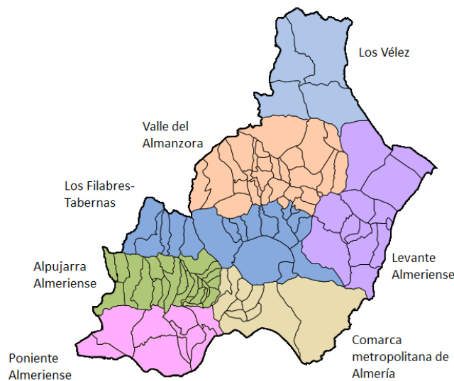
Figura 3. Comarcas de la provincia de Almería (orden de 14 de marzo de 2003)