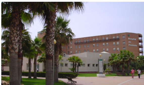
Hospital del Poniente (El Ejido)

xSeries 360 con cuatro procesadores Pentium 3 Xeon a 1,4 GB con Windows 2000 Advanced Server. Los sistemas están conectados a los 32 Centros de Atención Primaria dependientes del Hospital de Poniente, con más de cien usuarios diarios.