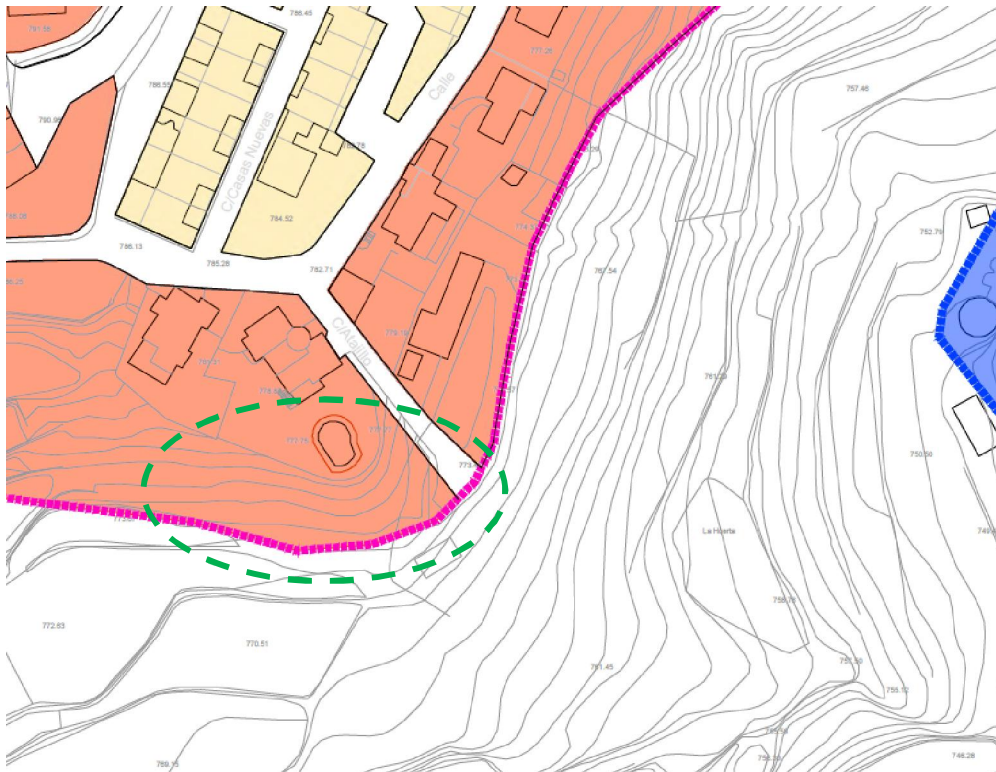
Imagen 1: Ámbito de la actuación

El Ámbito del Estudio de Detalle se encuentra en la zona sur del núcleo urbano de Félix, en vial en fondo de saco que parte de la C/ Atajillo, y se describe en la documentación gráfica. Este ámbito está clasificado dentro del Suelo Urbano según la AP del PDSU de Félix.